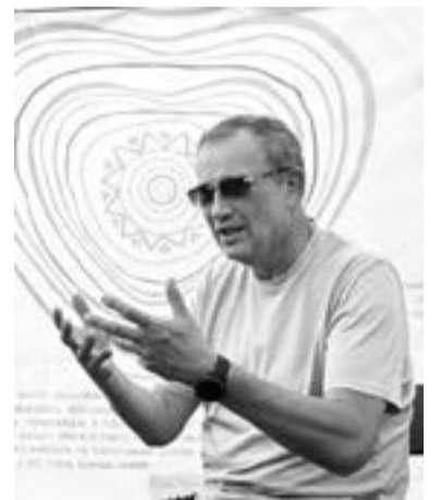
Александр Дрозденко на беседе с волонтерами

Общение с губернатором проходило в формате живого интервью. Например, волонтеры поинтересовались у Александра Юрьевича секретом борьбы с выгоранием на работе. Для многих работников социальной сферы именно ко-