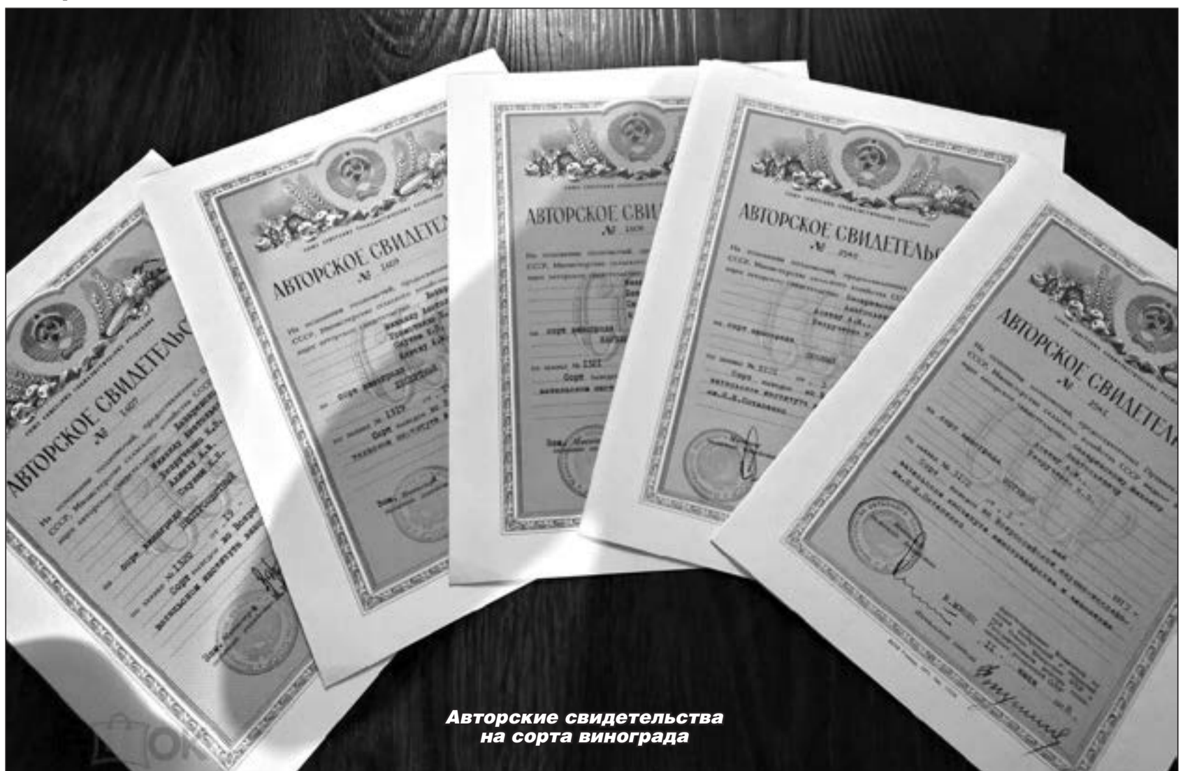
Авторские свидетельства на сорта винограда