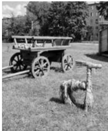
Фестиваль НКО украсила зона крестьянского быта

Главным событием Гражданского форума стал первый в Ленобласти Фестиваль некоммерческих организаций. В течение целого дня 25 сильнейших представителей сектора социальных инициатив презентовали коллегам и местным жителям свой опыт. Каждый раз это была не скучная лекция, а настоящая шоу-программа.