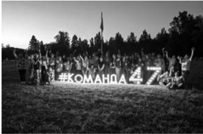
Участники Гражданского форума смогли насладиться природой Сланцевского района

На сегодняшний день в Сланцах действует лишь несколько социально ориентированных НКО, хотя у территории есть очевидный потенциал для развития. По задумке организаторов, трёхдневный десант самых активных представителей социальной сферы сможет вдохновить равнодушных местных жителей на запуск собственных проектов. Расчёт оправдал себя: на мероприятия форума приходили пенсионеры и молодёжь, опытные волонтеры и новички движения. Каждый мог узнать — как решиться на добрые дела, найти поддержку государства и даже создать собственную НКО с нуля.