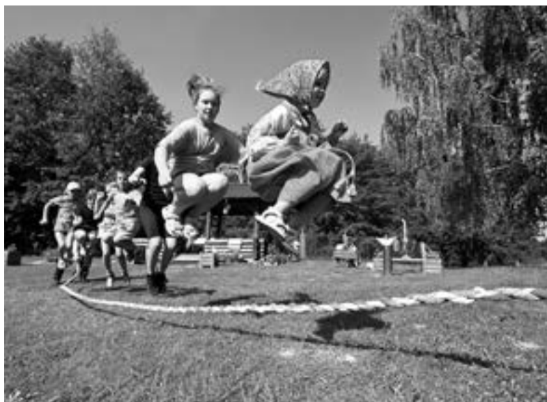
Представители НКО подготовили для местных жителей не только лекции, но и активные игры