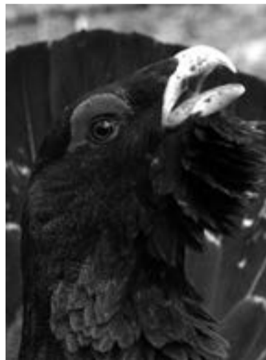
Голову глухаря украшают красные брови и мощный клюв

Глухарь не только самая крупная птица наших лесов, но и одна из самых красивых. Во время видеосъёмки из специальной маскировочной засидки мне не раз удавалось разглядеть его с расстояния нескольких метров. Грудь у самца фиолетово-зелёная с металлическим отливом. Удлиненные перья на подбородке образуют величественную бороду. На голове чётко выделяются красные брови и крючкообразный, мощный, как у орла, клюв. Любопытно, что большой веерообразный хвост глухаря состоит ровно из 18 перьев. Что до его веса, то он может достигать до 5 килограммов. А вот глухарки — вдвое меньше самцов и имеют пёструю маскировочную окраску.