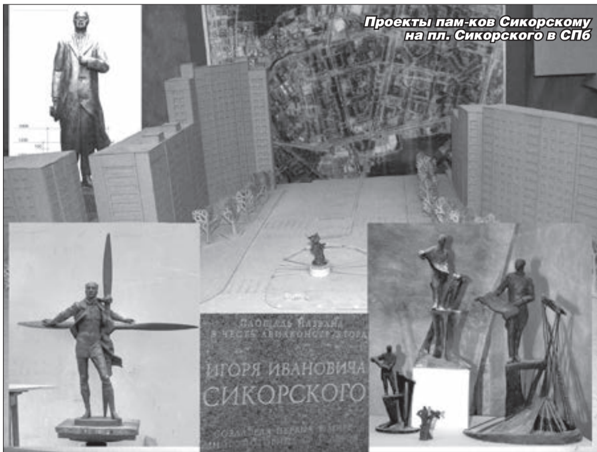
Проекты памятника Сикорскому на пл. Сикорского в СПб