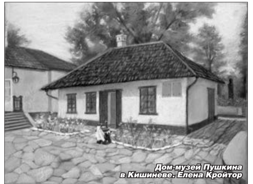
Дом-музей Пушкина в Кишиневе. Елена Кройтор

1 Весною пышно расцветают Под солнцем южные цветы, А грозы с ливнями питают Сухую землю. С высоты