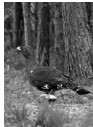
Весна — период брачных игр у глухарей

Причину столь необычного поведения учёные пока объяснить не могут. Была гипотеза, что всему виной патологически высокий уровень половых гормонов в брачный период — весны. Но в то же время описаны